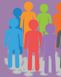
Salariés en CDDI